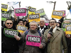
La protesta dei tassisti al Circo Massimo