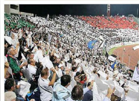
Scenografia bianca in curva al Friuli