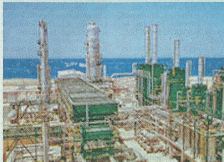
Un impianto di estrazione del greggio della Saipem

La fornitura per il colosso Saipem durerà sei mesi. L'ad Roustayan: l'operazione più importante mai chiusa